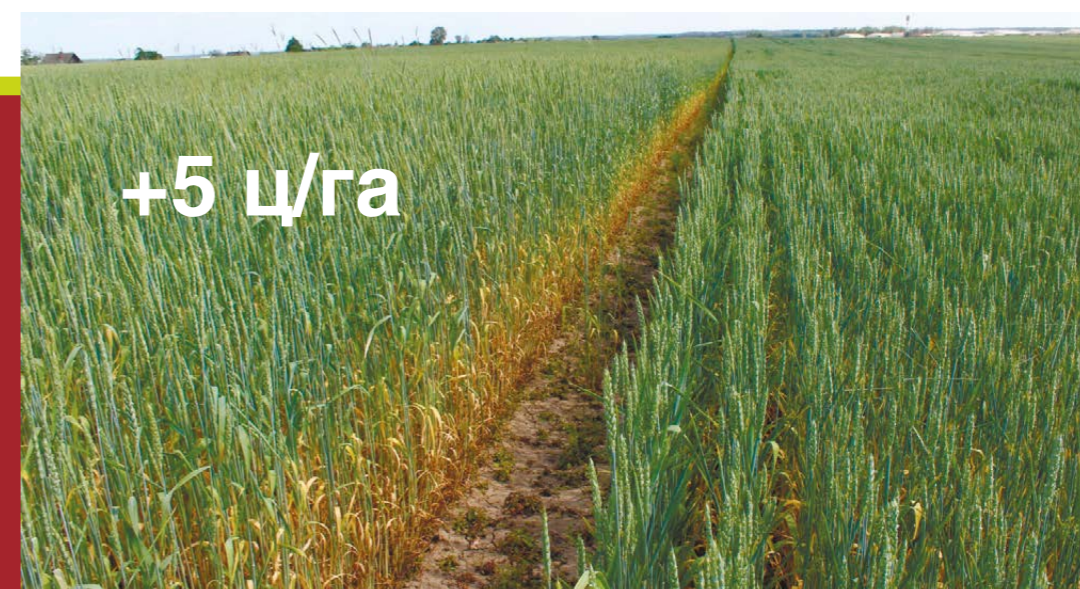
Сценик® Комби, 1,5 л/т (слева) в сравнении с оригинальным фунгицидным протравителем, 2 л/т (справа), 6 июня 2016 года

Использование инсекто-фунгицидного протравителя Сценик Комби, 1,5 л/т позволило получить прибавку +5 ц/га к оригинальному фунгицидному протравителю, 2 л/т!