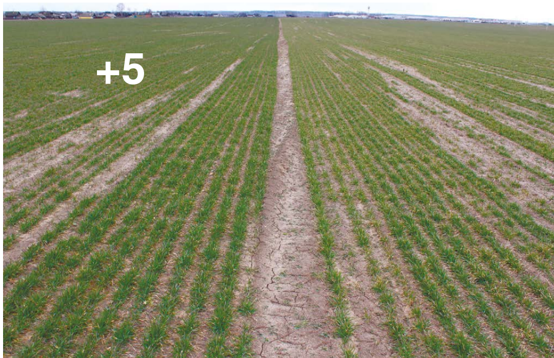
Сценик® Комби, 1,5 л/т (слева) в сравнении с оригинальным фунгицидным протравителем, 2 л/т (справа), 30 марта 2016 года

Сравнение динамики развития посевов озимой пшеницы на различных протравителях в ОАО «Тихиничи», Рогачевский район, Гомельская область, 2016 г.