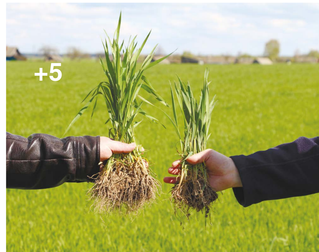
Сценик® Комби, 1,5 л/т (слева) в сравнении с оригинальным фунгицидным протравителем, 2 л/т (справа), 27 апреля 2016 года