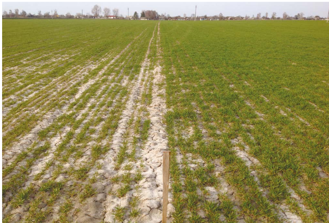
Фунгицидный протравнитель, 2,5 л/т (слева) в сравнении со Сцеником® Комби, 1,5 л/т (справа), 5 апреля 2016 года

Сравнение развития посевов озимой пшеницы на различных протравителях в ОАО «Туровщина», Житковичский район, Гомельская область, 2016 г.