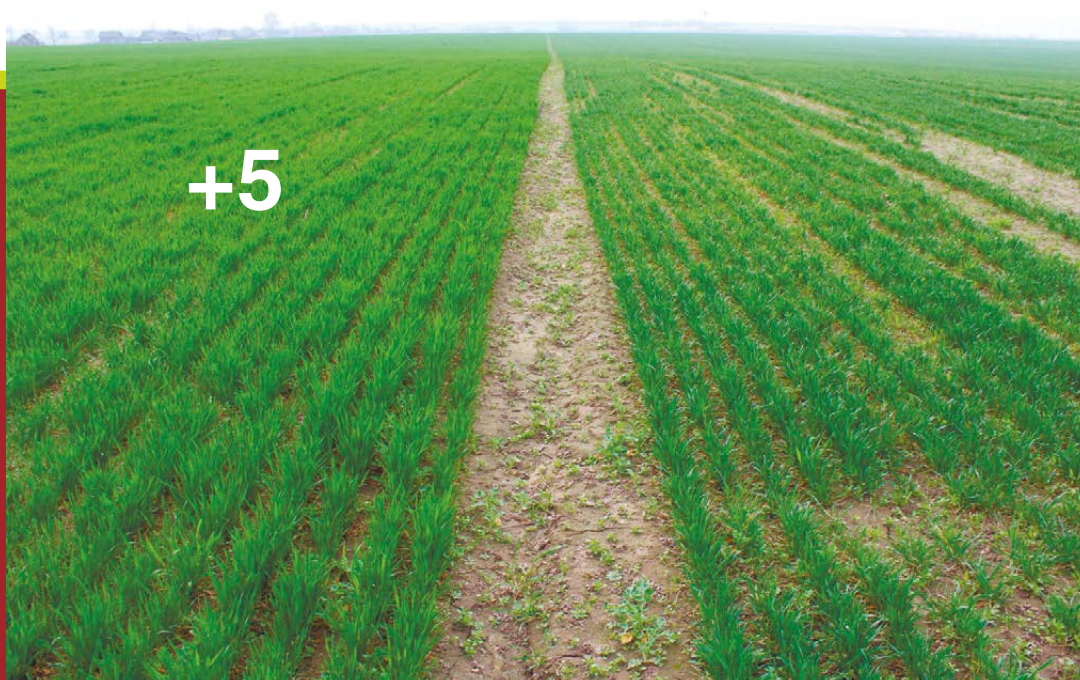
Сценик® Комби, 1,5 л/т (слева) в сравнении с оригинальным фунгицидным протравителем, 2 л/т (справа), 13 апреля 2016 года