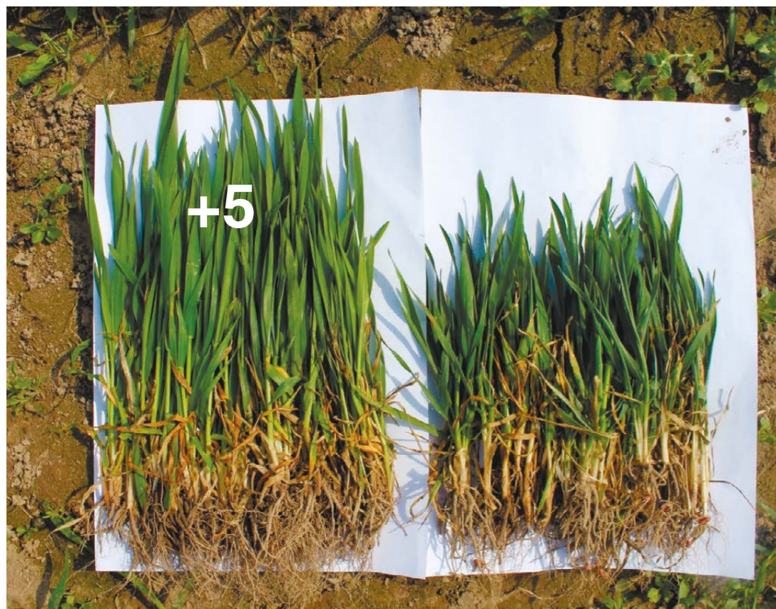
Сценик® Комби, 1,5 л/т (слева) в сравнении с оригинальным фунгицидным протравителем, 2 л/т (справа), 13 апреля 2016 года